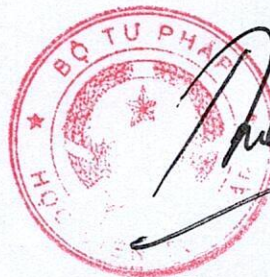
Trương Thế Côn